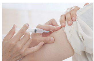
インフルエンザ 予防接種 (事業費 / 2,031万円)