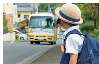
スクールバス 運行 (事業費 / 2億5,327万円)