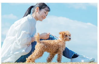
犬猫避妊去勢 手術補助金 (事業費 / 125万円)