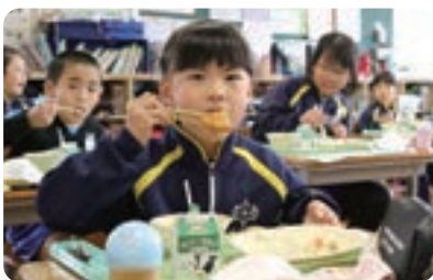
給食内容の充実 (事業費/1億2,383万円)