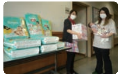
誕生時に支援品支給 (事業費/800万円)

お選びいただいた 使い道のご意向に沿って 行方市の さまざまな事業に 活用させていただいて おります