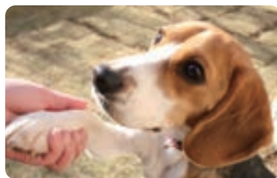
犬・猫の避妊、去勢手術補助金事業 (事業費/110万円)