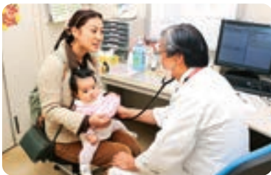
子供たちの医療費無料化 (事業費/2,093万円)

お選びいただいた 使い道のご意向に沿って 行方市の さまざまな事業に 活用させていただいて おります