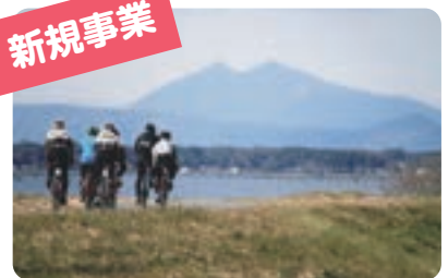
自転車活用推進事業 (事業費/100万円)